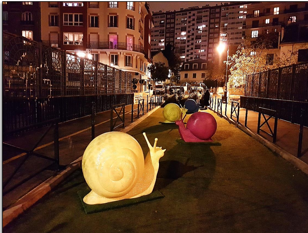
Légende image. #HautsDeSeine : Puteaux, décembre 2020. (Photo : @padam92 ).

La ville dans la transformation digitale et la transition écologique. « Le XIX ème siècle était un siècle d'Empires ; le XX ème siècle, celui des États-Nations. Le XXI ème siècle sera un siècle des villes. ». Wellington Webb, ancien maire de Denver (États-Unis) en 2009.