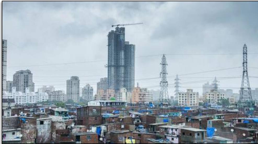
Légende image. À Bombay, les bidonvilles côtoient les gratte-ciel.

#Ville [Quatre émissions diffusées sur France Culture dans « Le nouvel empire des villes » du 27 au 30 mai]