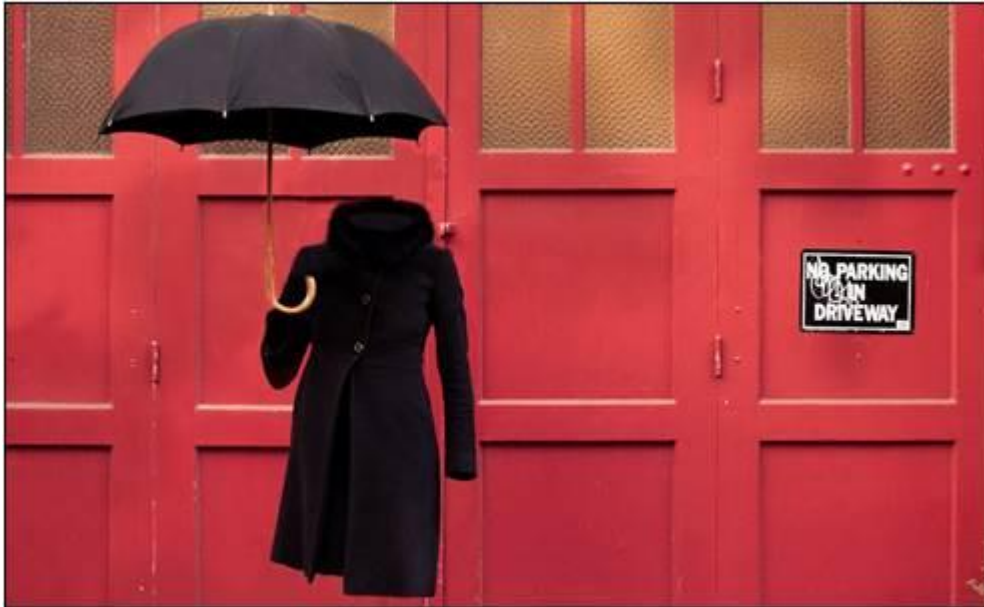
Légende image. « Invisible Woman », A lire : Avec le digital, l'humain est-il voué à disparaître ? (@HBRFrance).