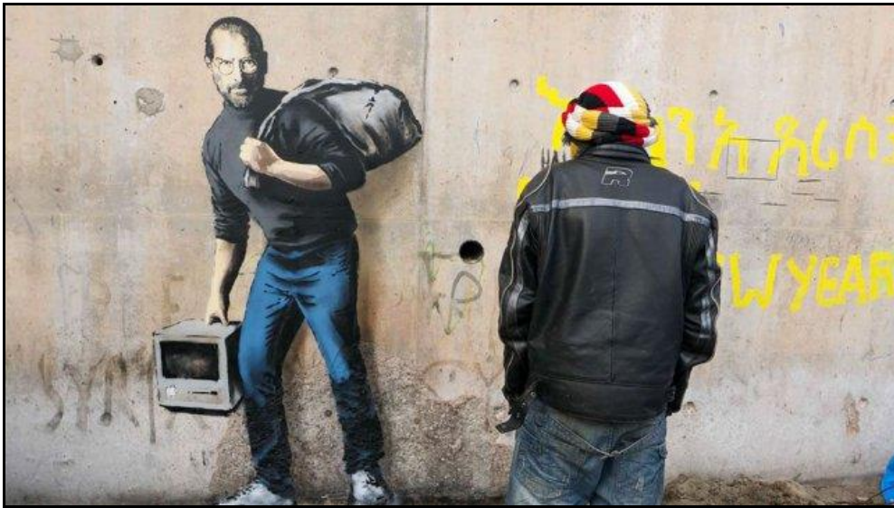
Légende image. Une fresque murale de Banksy dans la « jungle » de Calais. L'artiste ( banksy.co.uk ) dénonce par ses dessins la crise des réfugiés.

#RevueDActu [Consulter la ReVue d'actu quotidienne publiée sur le blog Régions FTV. ]