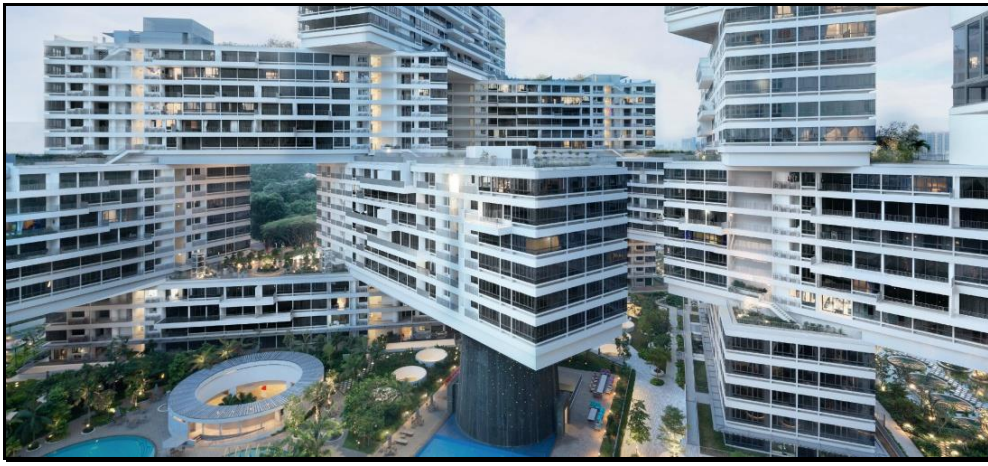
Légende image. Et si le gratte-ciel couché était l'avenir du logement ? The Interlace à Singapour | Buro Ole Scheeren. (@Slatefr). #Lego