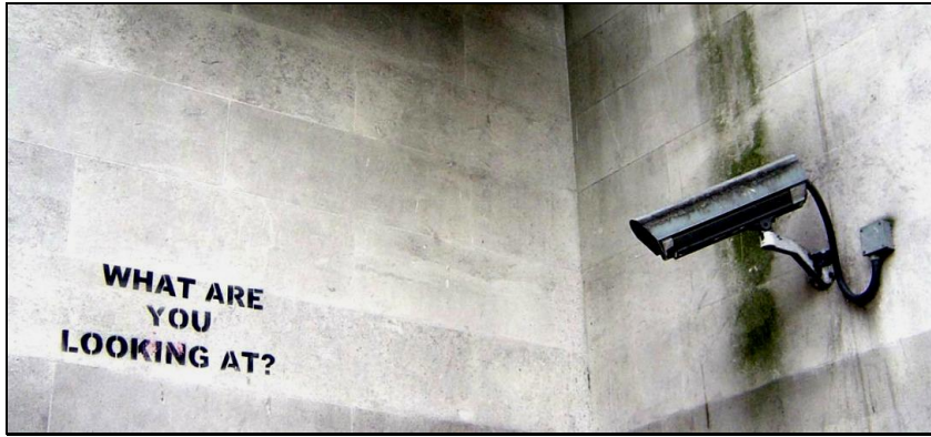
Légende image. What are you looking at ?