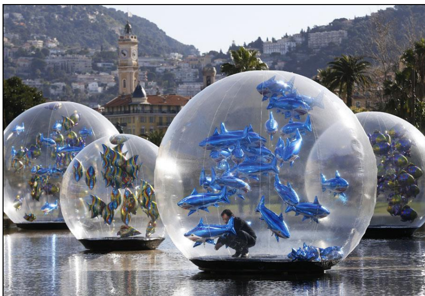
Légende image. Une installation artistique exposée dans une fontaine de Nice (Alpes-Maritimes), le 1er avril 2015.