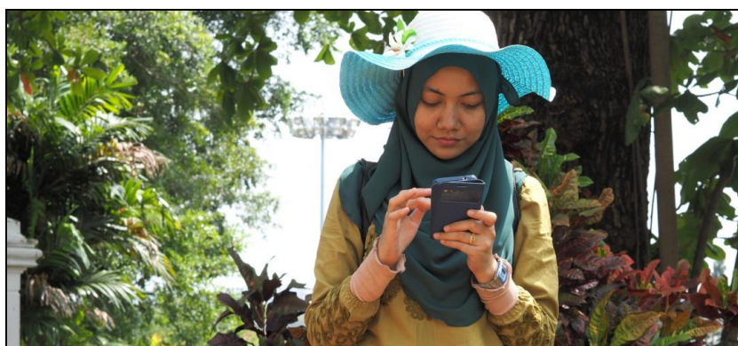
Légende image. Smartphone à St. Paul Hill – Malacca en Malaisie. (Photo John Ragai via Flickr CC Licence By).

Revue de liens sauvages. Des liens glanés dans les champs de l'information du cyberespace que vous pouvez retrouver chaque jour dans Liens sauvages#179 (du 3 au 9 avril 2015).