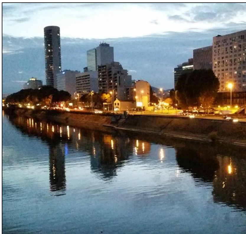
Légende image. Un samedi de novembre près du pont de Neuilly. Fin de journée. Instagram : @padam92 .

Revue de liens sauvages. Des liens glanés dans les champs de l'information du cyberespace que vous pouvez retrouver chaque jour dans Liens sauvages#173 (du 20 au 26 février 2015) et Liens sauvages#174 (du 27 fév. au 5 mars 2015).