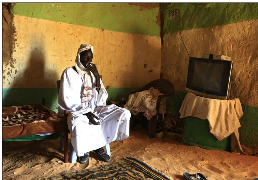
Légende image. Un bédouin soudanais dans sa maison à Malha (Soudan), le 13 février 2015. (Photo Mohamed Nureldin Abdallah / Reuters).