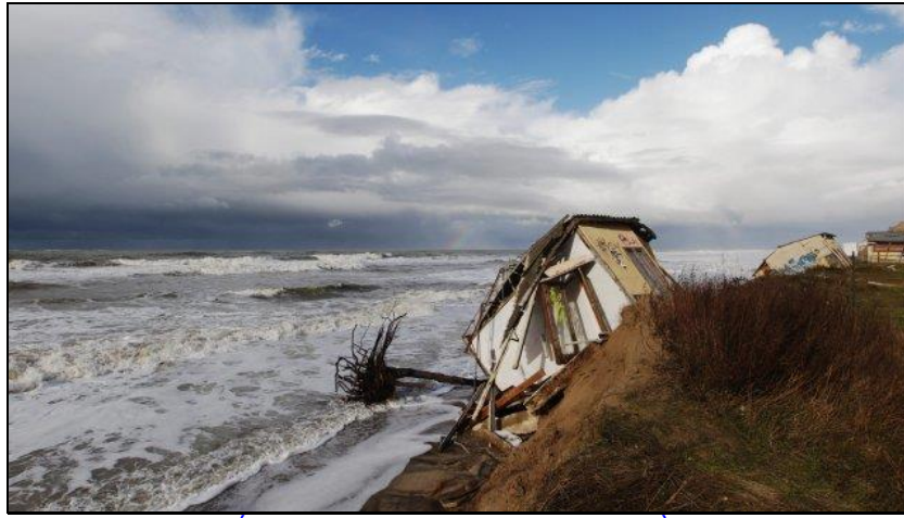
Légende image. Érosion du littoral en Aquitaine : À vos témoignages !