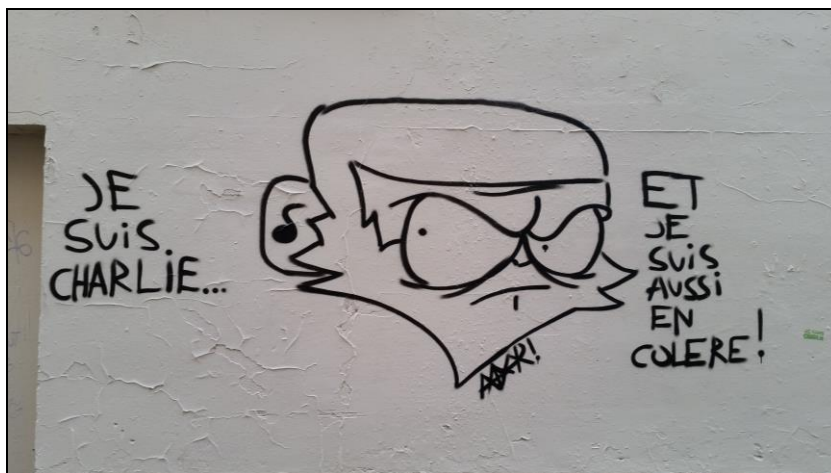
Légende image. Près de la place de la Bastille, un dimanche 11 janvier 2015 (@padam92).

Revue de liens sauvages. Des liens glanés dans les champs de l'information du cyberspace que vous pouvez retrouver chaque jour dans Liens sauvages#167 (du 9 au 15 janvier 2015) et Liens sauvages#168 (du 16 au 22 janvier 2015).