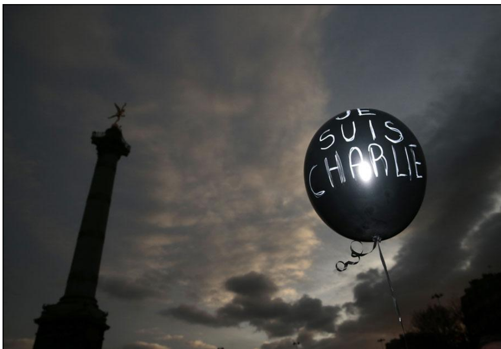
Légende image. La marche républicaine du 11 janvier à Paris.

Télécharger Régions.news#166 version PDF