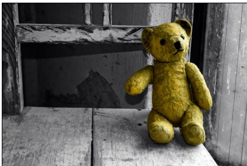
Légende image. Les enfants, nouvelle source d'inspiration pour les start-ups . Par Barbara Chazelle. « La prochaine génération sera sans aucun doute plus connectée que jamais. Dès leur plus jeune âge, les enfants se divertissent, apprennent, communiquent sur toute sorte d'écrans connectés. »

Le site Méta-Media alimenté par Eric Scherer, édite chaque semaine « Liens vagabonds old et new media ». Consulter ceux du 13 décembre 2014 et notamment :