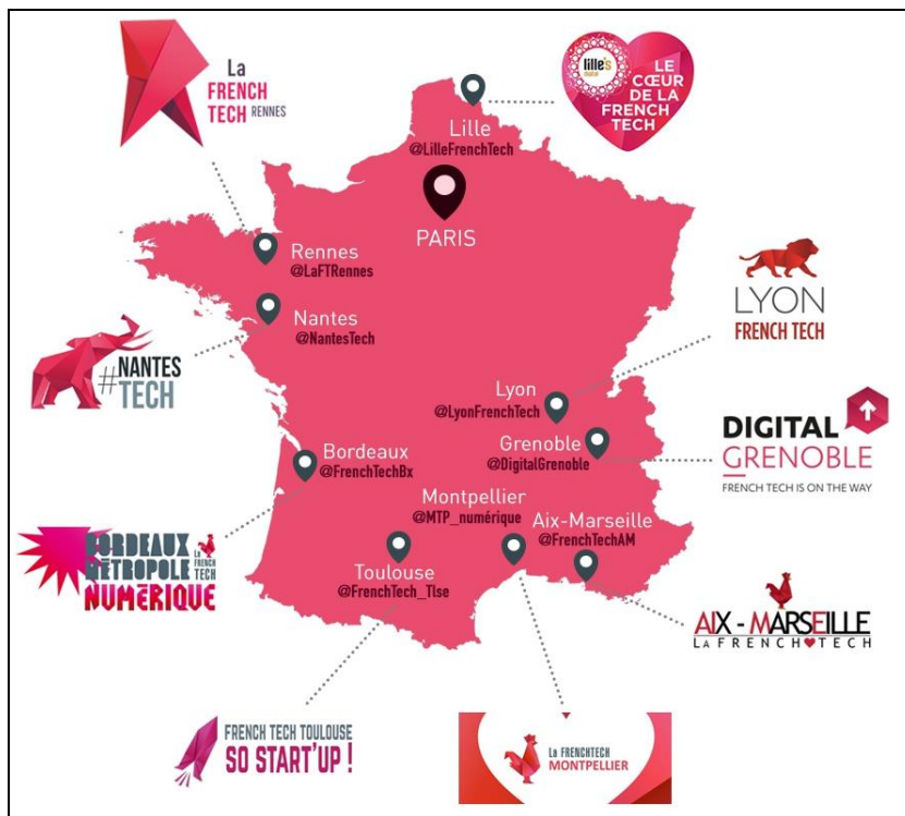
Légende image. Voir la carte interactive sur la publication Storify : Les neuf villes labellisée "French Tech"

La secrétaire d'État au Numérique Axelle Lemaire a dévoilé, mercredi 12 novembre, les neuf premières métropoles qui bénéficieront du label « French Tech » , conçu pour favoriser la création de start-up et le développement des talents dans le numérique. Elle explique au quotidien Le Monde que cette labellisation doit permettre de « valoriser les écosystèmes existants afin d'impulser un mouvement local, mais aussi de les fédérer pour créer un réseau national (...) afin que les investisseurs internationaux voient la France comme une nation innovante, un acteur incontournable du numérique, qui dispose d'un écosystème vibrant et dynamique. »