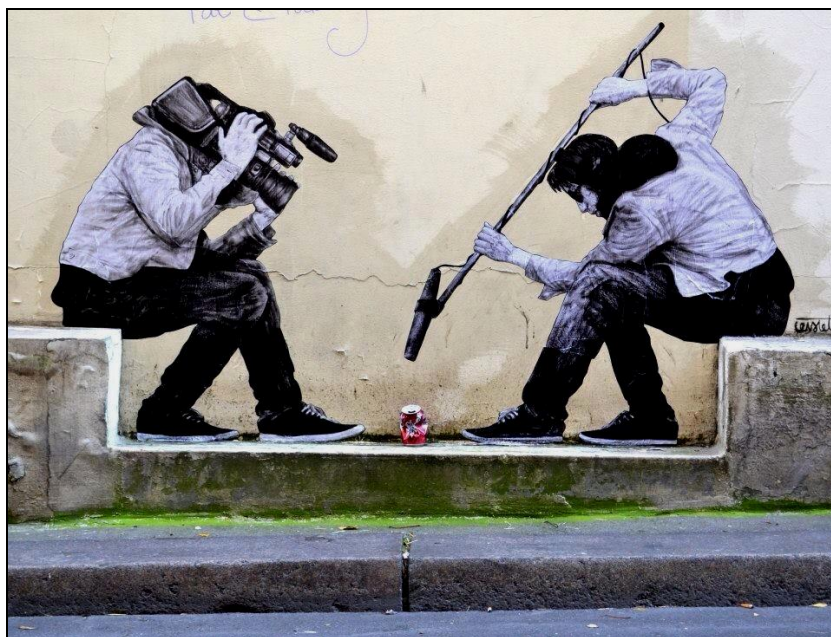
Légende image. Brilliant new Street Art by #Levalet in Paris. Voit le site http://www.levalet.org/

Revue de liens sauvages. Des liens glanés dans les champs de l'information du cyberspace que vous pouvez retrouver chaque jour dans Liens sauvages#160 (du 7 au 13 novembre 2014) et Liens sauvages#161 (du 14 au 20 novembre 2014).