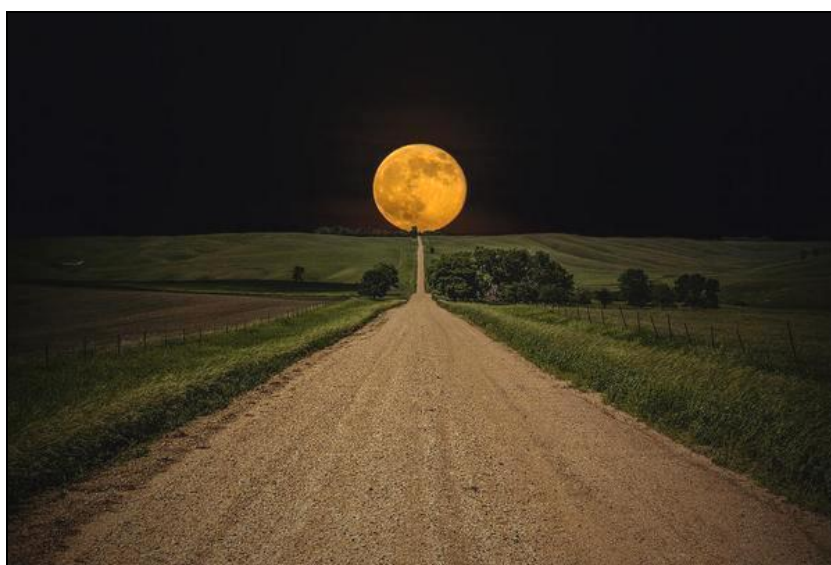
Légende image. Une super lune se lève au-dessus d'une route quelque part à l'est du Dakota du Sud en octobre 2014.