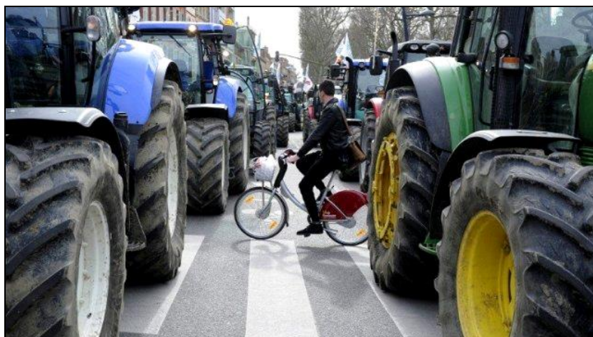
Légende image. Les tracteurs envahissent la rue à Toulouse sur le chemin de la préfecture.

Consulter la ReVue d'actu quotidienne publiée sur le blog Régions FTV avec chaque jour cinq à sept liens les plus pertinents édités par les sites régionaux de France3.fr.