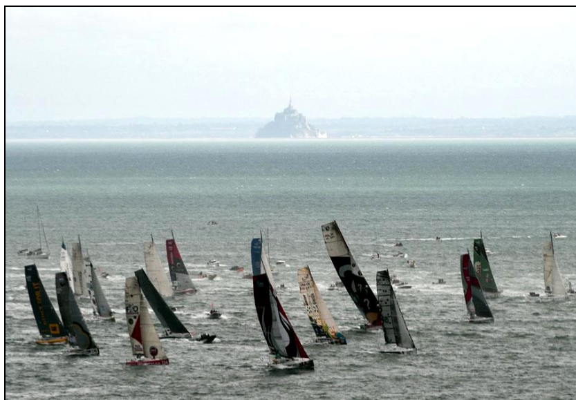
Route du rhum. Des marins sur-connectés... Et la solitude bordel ! Les satellites, le numérique et les obligations médiatiques ont rattrapé les marins de l'extrême. (@LeNouvelObs).

#NDDL (Pays-de-la-Loire). Manuel Valls confirme la réalisation de l'aéroport de Notre-Dame-des-Landes dans une lettre reçue par l'association des Ailes pour l'Ouest favorable à l'Aéroport du Grand Ouest, le Premier ministre affirme l'engagement de l'État à transférer l'aéroport de Nantes