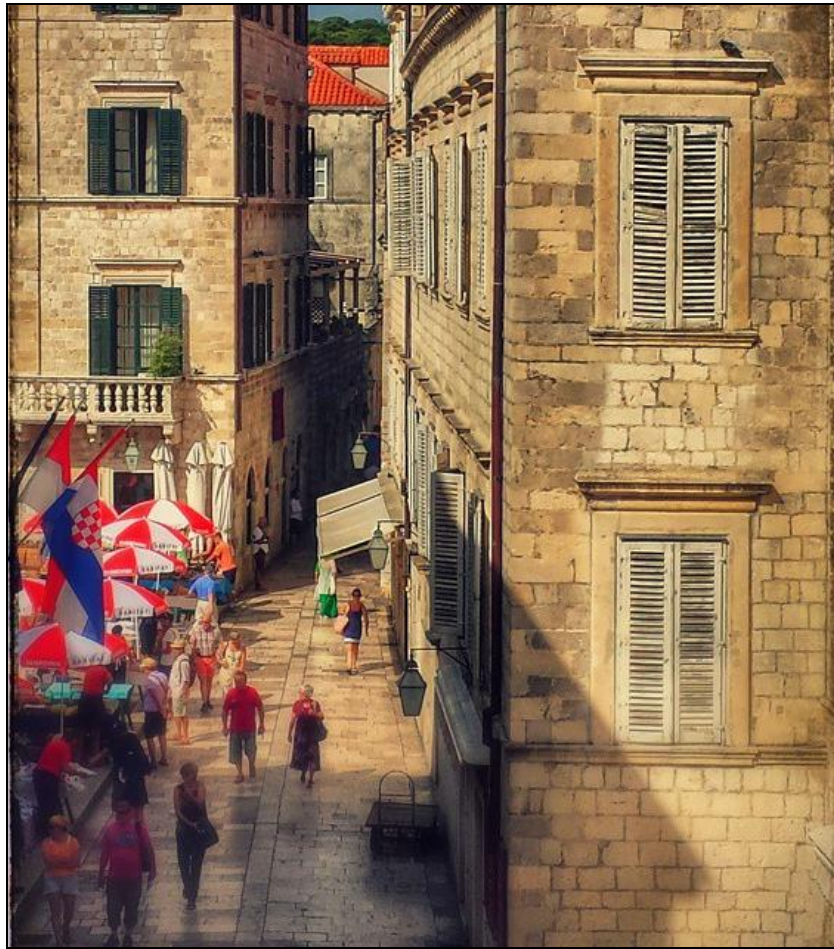
Légende image. #Dubrovnik #Croatie.

Revue de liens sauvages. Des liens glanés dans les champs de l'information du cyberspace que vous pouvez retrouver chaque jour dans Liens sauvages#156 (du 10 au 16 octobre 2014) et Liens sauvages#157 (du 17 au 23 octobre 2014).