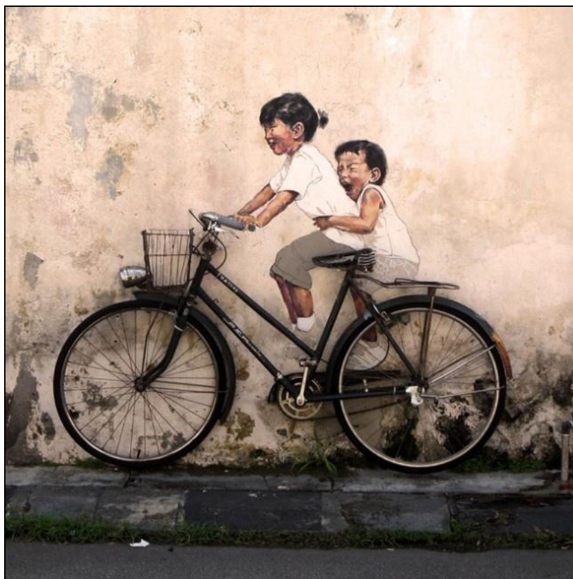
Légende image. Street Art @StreetArtepics . Amazing pictures of Street Arts Around The World.