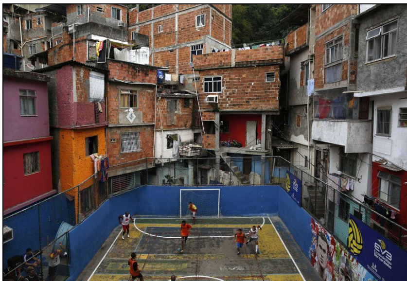
Légende image. Des jeunes jouent au football dans une favela de Rio de Janeiro (Brésil), le 18/05/14.

Télécharger Régions.news#138 version PDF