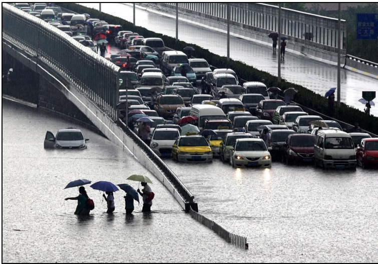
Une route inondée, à Wuhan (Chine), le 7 juillet 2013.. (Photo AFP). Diaporama Un œil sur l'actu par Elodie Drouard / FranceTV info .

Télécharger Régions.news#95 en version PDF.