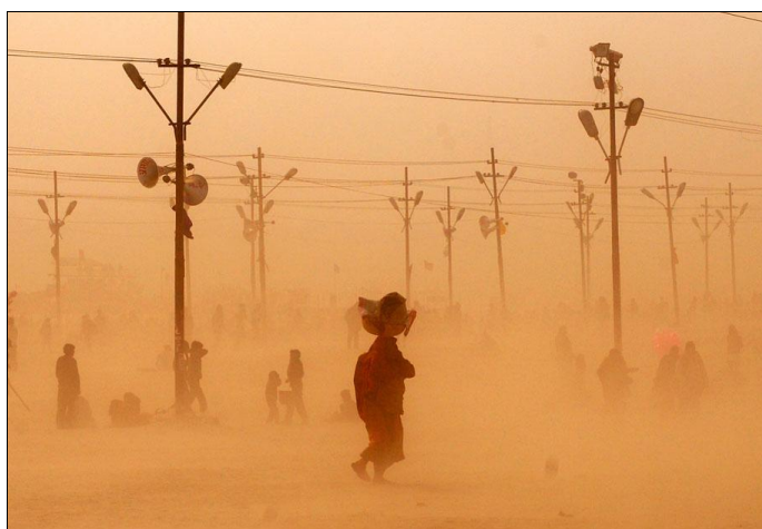
Tempête de sable sur les berges du Gange à Allahabad (Inde), le 5 février 2013. Diaporama Un œil sur l'actu de FranceTV info

Télécharger Régions.news#73 en version PDF