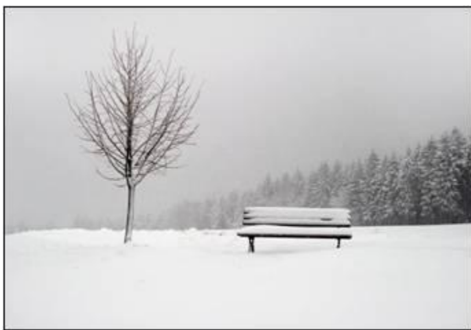
Photo prise à Oberfrauendorf, dans l'est de l'Allemagne. Diaporama FranceTV info : petit tour d'Europe sous la neige

Télécharger Régions.news#64 en version PDF.