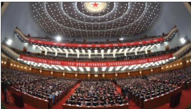
Le 18e Congrès national du Parti communiste chinois s'est ouvert jeudi 8 novembre à Beijing. A quoi sert le Congrès du parti communiste?

Télécharger Régions.news#61 en version PDF.