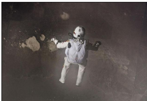
L'Australien Felix Baumgartner saute de sa capsule située à plus de 39 km de la Terre, le 14 oct. 2012. ©Jay Nemeth / AFP - Diaporama FTV info .

Télécharger Régions.news#58 en version PDF.