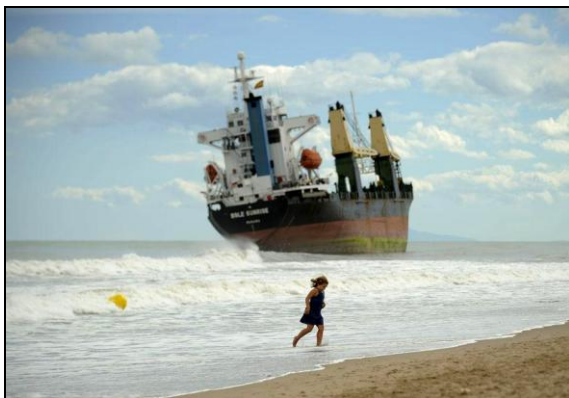
Un cargo est échoué près de Valence (Espagne) suite à de violentes chutes de pluie (le 29/09/2012).

Télécharger Régions.news#56 en version PDF.