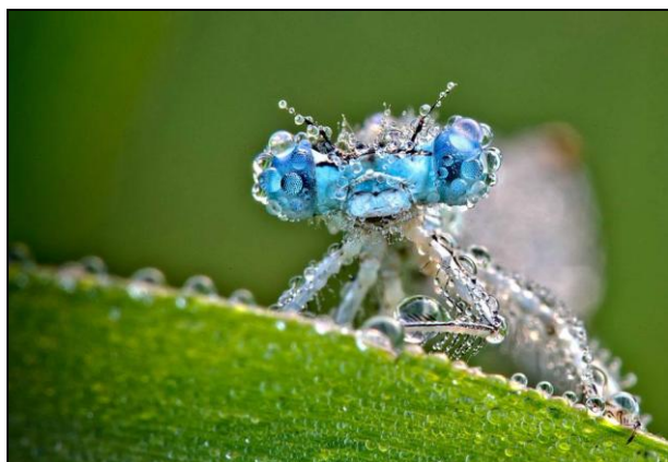
Une libellule recouverte de rosée, un matin en France.

Télécharger Régions.news#54 en version PDF.