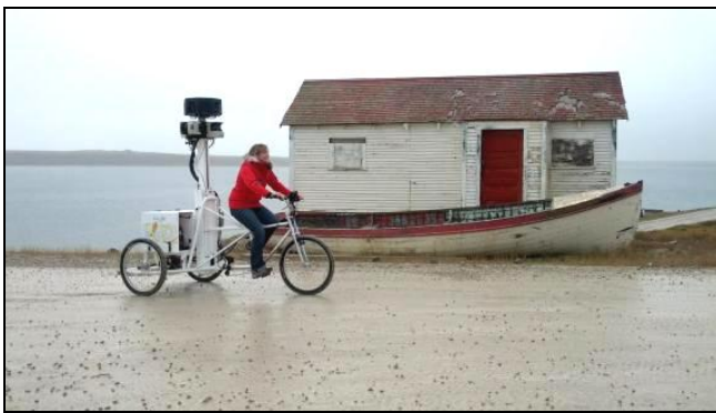
Google Street View chez les Inuits @FranceTV info

Télécharger Régions.news #51 en version PDF