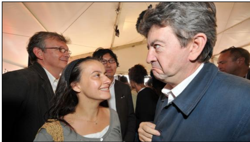
Cécile Duflot et Jean-Luc Mélenchon, le 12/09/2009 à La Courneuve (92).

Réagissant aux critiques de Jean-Luc Mélenchon sur les cent premiers jours du gouvernement, Cécile Duflot se lâche : « Il a raison sur un certain nombre de choses. (...) Mais j'ai envie de dire 'viens mon lapin et assieds-toi de l'autre côté de la table de gouvernement' ».