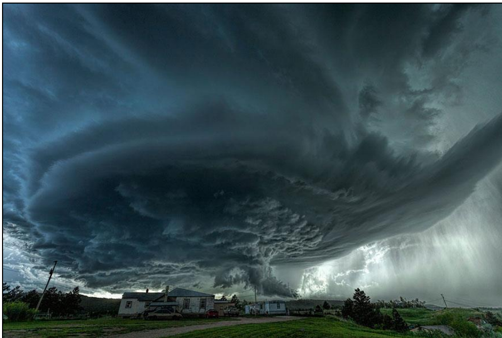
Légende image. Une tempête à Blackhawk, Dakota du Sud.

Télécharger Régions.news#229 version PDF