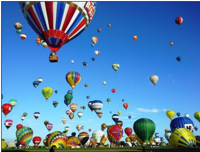
Légende image. #LMAB Lorraine Mondial Air Ballons, par Jean-Christophe Dupuis-Rémond (France 3 Lorraine)

Le site Meta-Media alimenté par Éric Scherer, édite chaque semaine « Liens vagabonds old et new media ». Consulter ceux du 11 juillet 2015 et notamment :