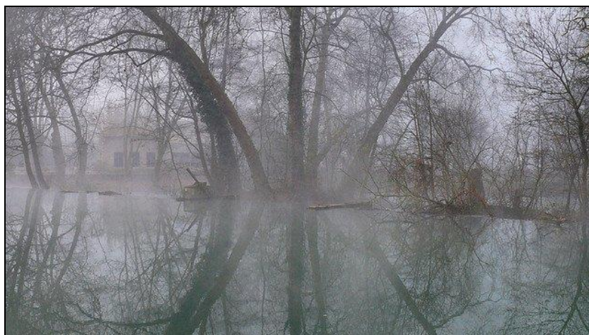
Légende image. La Roussille, Marais Poitevin, Deux-Sèvres.

Consulter la ReVue d'actu quotidienne publiée sur le blog Régions FTV avec chaque jour cinq à sept liens les plus pertinents édités par les sites régionaux de France3.fr.