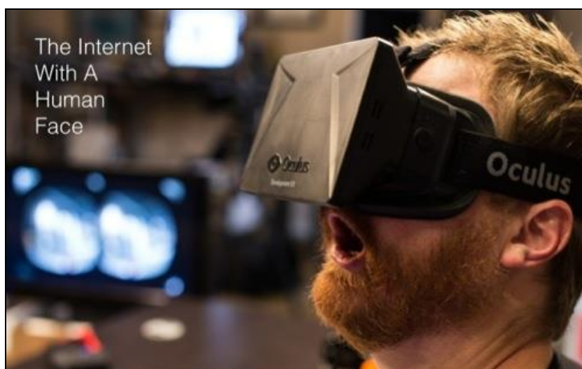
Légende image. Un Internet à visage humain