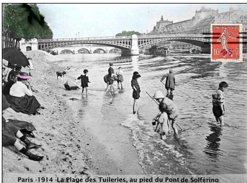
Paris -1914 -La Plage des Tuileries, au pied du Pont de Solférino

Légende image. @ornikkar . Paris Plage, il y a 100 ans, ça avait de la gueule non ? via @parisvisites >> pic.twitter.com/FROJaYLoBB