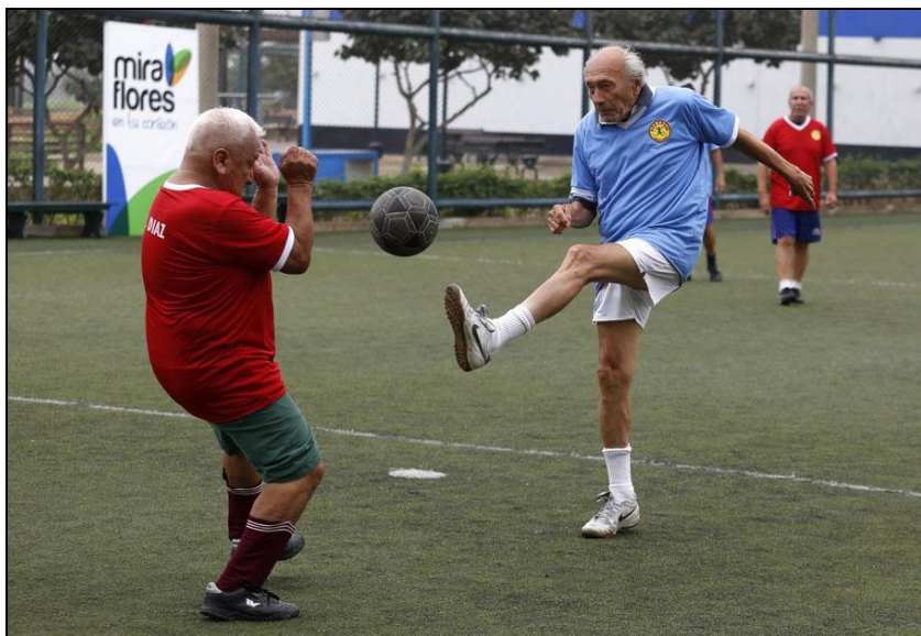
Légende image. Des seniors jouent au football à Miraflores (Pérou), le 19 juin 2014.

Télécharger Régions.news#142 version PDF