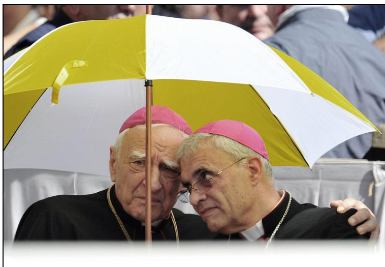
Deux évêques se protègent du soleil sur la place Saint-Pierre, au Vatican, le 19 juin 2013. Diaporama Un œil sur l'actu par Elodie Drouard / FranceTV info .

Télécharger Régions.news#92 en version PDF.