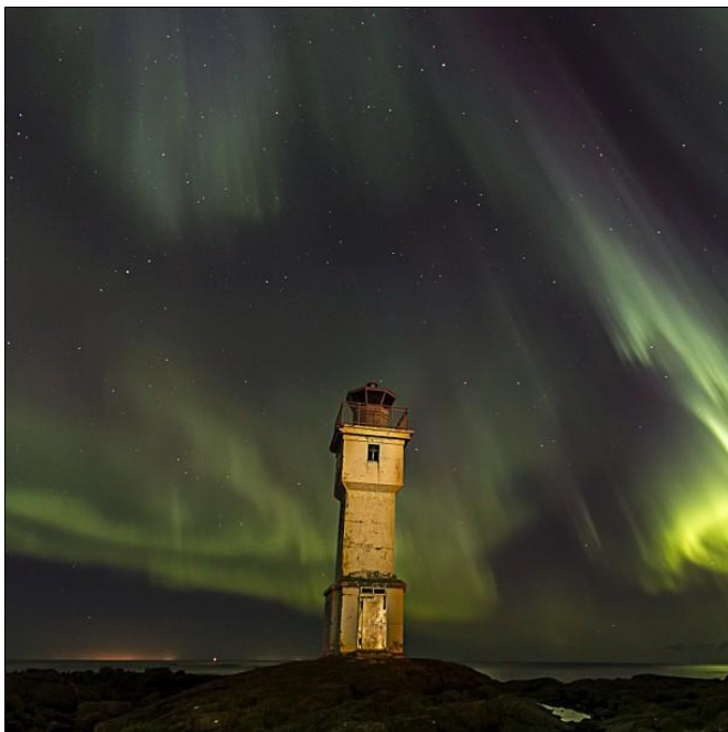
Aurore boréale en Islande. @cnnireport ©Thorarinn Jónsson

Télécharger Régions.news#69 en version PDF.