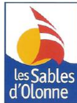
Les Sables d'Olonne

Merci aux mairies pour leur accueil et partenariat